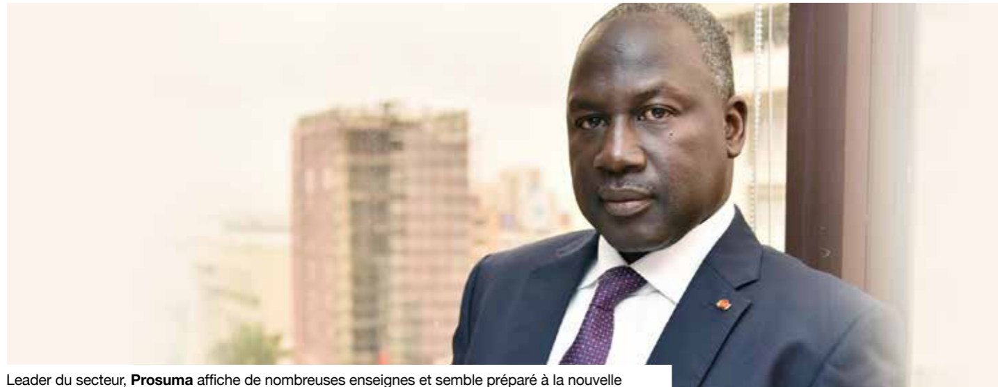
Leader du secteur, Prosuma affiche de nombreuses enseignes et semble préparé à la nouvelle

Interview réalisée par Betty BAH et Souleymane KONÉ