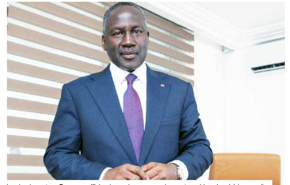
Leader du secteur, Prosuma affiche de nombreuses enseignes et semble préparé à la nouvelle

Je pense que les pré-congrès ont donné l'impression que trop souvent, les militants, les secrétaires de section, les commissaires politiques, les jeunes ont été oubliés. Je voudrais leur dire que le Président Ouattara que nous avons porté à la magistrature suprême a donc permis à la Côte d'Ivoire de retrouver toute sa dignité. Pendant toute cette période, il a du se consacrer et se sa-